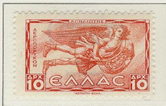
Απηνιώτης - Ανατολικός άνεμος με τη μορφή νέου που φέρνει σάρι και καρπούς.