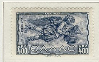
Σκίρων, Βορειοδυτικός άνεμος, μαΐστρος με τη μορφή γέροντα που κρατεί το αγγείο της αφθονίας.