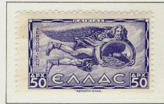
Καϊκίας, Βορειοανατολικός άνεμος με τη μορφή γέροντα που εκκινάζει χαλάζι από την ασπίδα του.