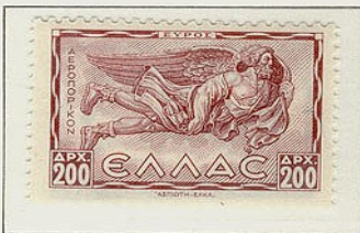
Εύρος, Νοτιοανατολικός άνεμος, με τη μορφή γέροντα καλυπτόμενος με το χιτώνα του για να αποφύγει την επερχόμενη βροχή.