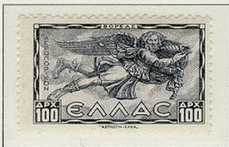
Βορέας - Βόρειος άνεμος, με τη μορφή γέροντα που κρατά κόγχη, δηλωτικό του βορρύνου που προκαλεί.