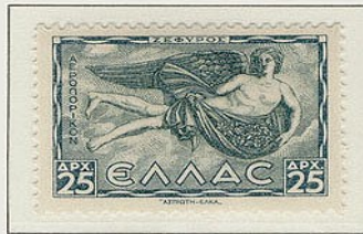
Ζέφυρος, Δυτικός άνεμος με τη μορφή νέου με το χιτώνα του γεμάτο άνθη.